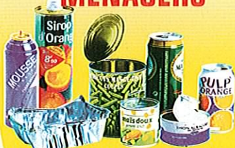
Boîtes et bouteilles métalliques