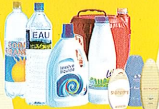
Bouteilles et flacons en plastique (avec bouchons)