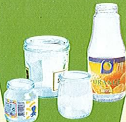
Pots et bocaux