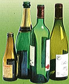
Bouteilles et cannettes