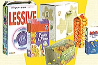
Briques et cartonnettes